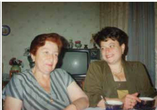
С любимой мамочкой, 1985 г.