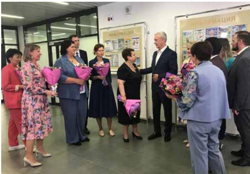
Мэр Москвы Сергей Собянин поздравил коллектив школы № 1518 с Днем учителя, 2022 г.